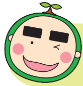
福ちゃん（稲沢市社会福祉協議会マスコットキャラクター）

これまでの公的サービスや制度だけでは、これからの 超少子高齢型人口減少社会 の課題に対応することが困難になるからだよ。