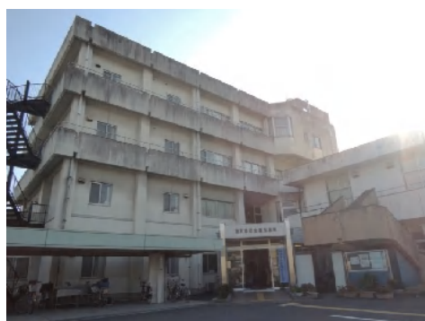
社会福祉会館全景